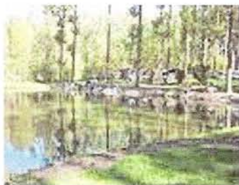
Son étang de pêche